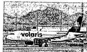
LAS NUEVAS rutas con destino a La Paz, Mazatlán y Puerto Vallarta

Abundó que se retomará el contacto con American Airlines y algunas líneas internacionales con la idea de que se abran nuevas rutas al país vecino, esto cuando México recobre la categoría 1 en seguridad aérea.