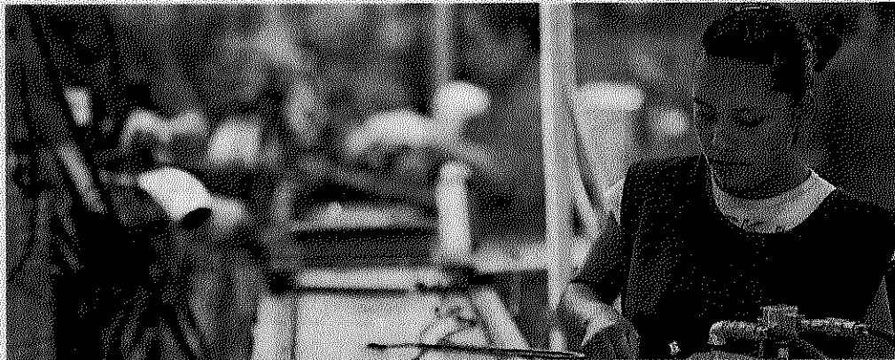
LOS TRABAJADORES de maquiladoras podrían recibir hasta un 20% de alza salarial, de acuerdo con Index Juárez