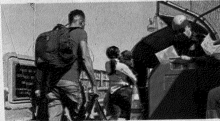
DESDE EL 20 de marzo de 2020 CBP ha expulsado de manera expés a más de un millón de personas