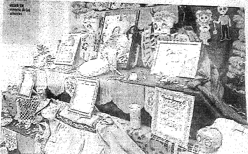
MONTE ALTA LA CEDH

La adjudicación directa se determinó porque la más rápida posible la realización de las rutas a los residentes para brindar servicios al ciudadano que tenían necesidades provisionales de basura por parte de personal de la dependencia municipal.