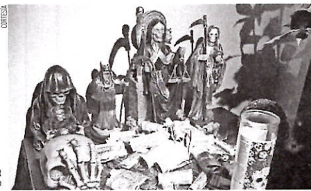
EL ALTAR encontrado