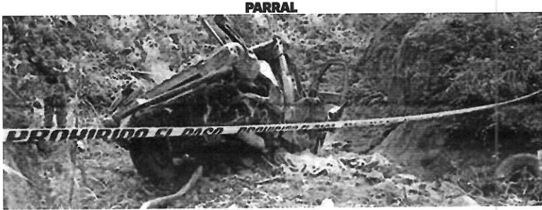
EL ACCIDENTE ocurrió cerca de la comunidad denominada "Arroyo de la Oscuridad"