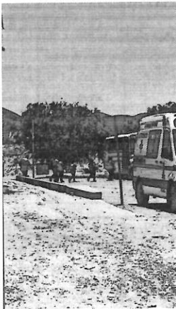
ANTEAYER SUCUBI un caso parecido, sin embargo nadie lo reportó a las autoridades

La situación sigue en desarrollo y se espera que las autoridades locales, tomen medidas adicionales para garantizar la seguridad de los empleados y prevenir futuros incidentes. Insistieron en que la causa probable sea la inhalación de polvo de Chile, la cual sería la teoría más lógica.