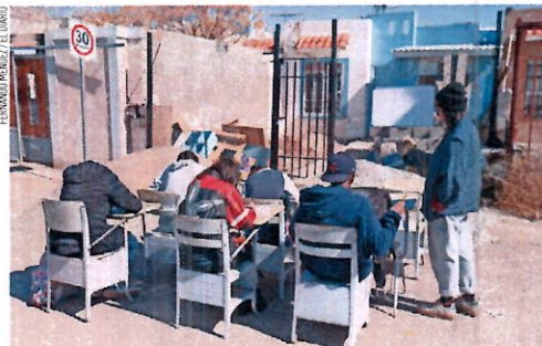
AYER TOMARON clases con menos de 15 grados centígrados de temperatura

Tres de los hechos ocurrieron el viernes 9 de febrero