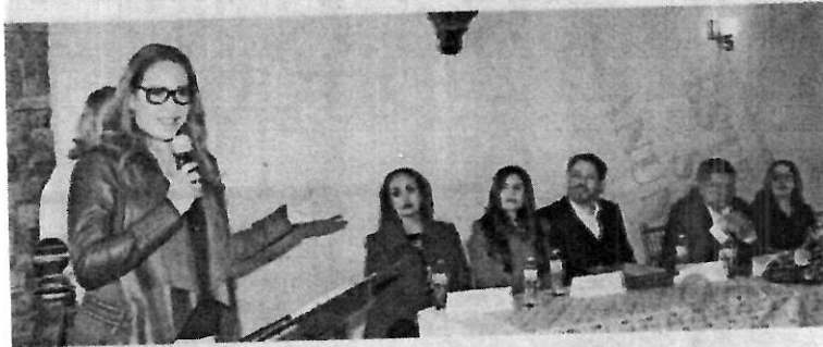
LA FUN-DADORA de Agenda de Mujeres y otros grupos sociales recibirá su nombramiento oficial el próximo viernes