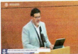
Motosierra al Trife, advierte afectación "seria" para elecciones