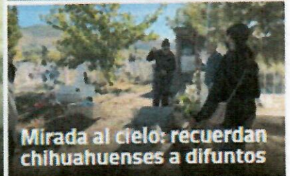
Mirada al cielo: recuerdan chihuahuenses a difuntos