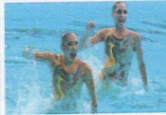
Santiago 2023: Gana México oro y boleto a Olímpicos en sincronizado