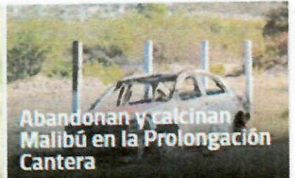
Abandonan y calcinan Malibú en la Prolongación Cantera