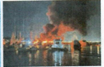
Al menos 10 embarcaciones dañadas tras incendio en La Paz