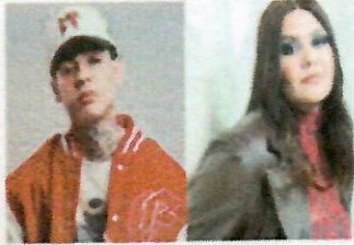
¿A ti no te sale! Critican a Natanael Cano por cover de Yuridia