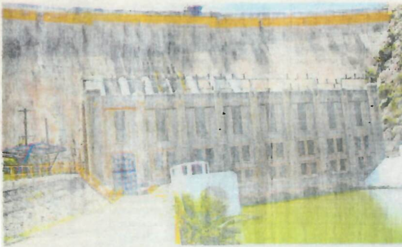
CONFLICTO REGISTRADO en presa La Boquilla se derivó de un intento de la Federación por pagar el recurso requerido