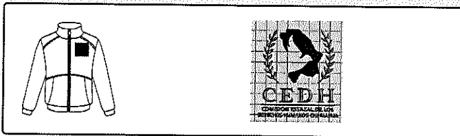
Imagen: CEDH.PNG Hilo: Alto: 1 Ancho: 1 UM: cm Letra: Etiqueta: N/A Tipo: Bordado Color:

Descripción / nota: HILO ROJO CAMBIAR A 1020