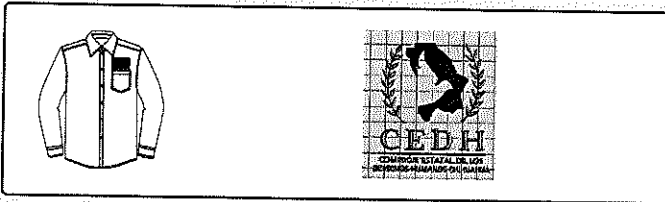
Imagen: CEDH.PNG Hilo: Alto: 1 Ancho: 1 UM: cm Letra: Etiqueta: N/A Tipo: Bordado Color:

Descripción / nota: HILO ROJO CAMBIAR A 1020