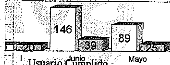
Consumos Mes y Año