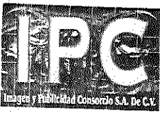
IMAGEN Y PUBLICIDAD CONSORCIO S.A. DE C.V.

C. BERLIN No. 2204, COL. MIRADOR C.P. 31205 TEL. (614) 260-31-71 CEL (614) 494-81-08 CHIHUAHUA, CHIH. R.F.C. IPC-051209-DM6